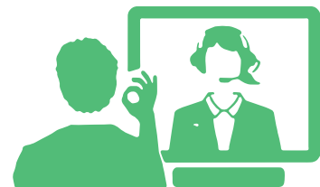
ვიდეო ზარის სერვისი