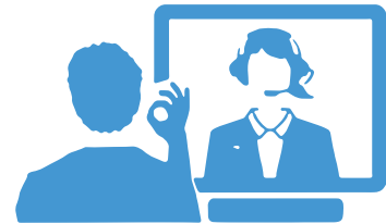
ვიდეო ზარის სარვისი