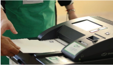
Ձայների հաշվման հատուկ էլեկտրոնային սարքի մեջ քվեաթերթիկը ներմուծելը

«Քվեաթերթիկը հատուկ շրջանակ-ծրարի միջոցով այնպես ներմուծե՛ք սարքի մեջ, որ քվեաթերթիկի այն մասը, որի վրա գտնվում է փորձնական շրջանը, հայտնվի ներքևում: Շրջանակ-ծրարը թեթև պահե՛ք, որպեսզի սարքը հեշտությամբ ընդունի քվեաթերթիկը: Սպասե՛ք մինչև սարքի էկրանին հայտնվի «Ձեր ձայնը ստացվել է» հաղորդագրությունը և միայն դրանից հետո դո՛ւրս եկեք քվեարկության շենքից»: