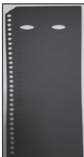
ფოტო 1 ბიულეტენის შესავსები ჩარჩო/ფორმა

რეგისტრატორი კომისიის წევრი ვალდებულია უსინათლო ამომრჩეველს მიაწოდოს ინფორმაცია საარჩევნო ბიულეტენში არსებული საარჩევნო სუბიექტების რიგითობის შესახებ.