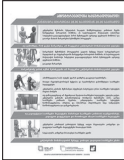
ფოტო 4 კენჭისყრაში მონაწილეობის ამსახველი პოსტერი