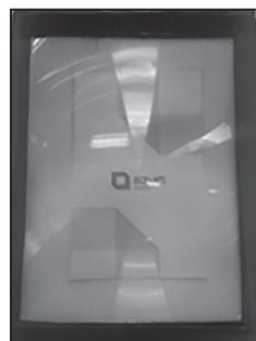
Լուսանկար 2. Խոշորացնող տեսապակի՝ լինզա