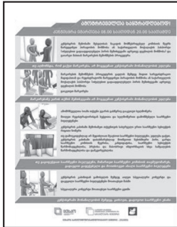
Լուսանկար 4. Քվեարկությանը մասնակցությունն արտացոլող պաստառ