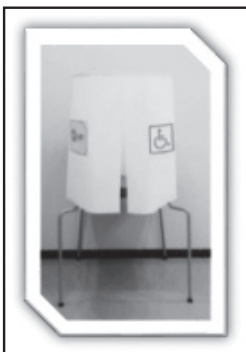
Լուսանկար 3. Հատուկ քվեախցիկ

Կտրականապես արգելվում է հենվել սայլակին կամ սայլակից օգտվող ընտրողին ինքնակամ տեղաշարժելը: