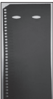
Լուսանկար 1. Քվեաթերթիկը լրացնելու շրջանակ/հատուկ ձև

Ընտրողների գրանցում իրականացնող հանձնաժողովի անդամը պարտավոր է տեսողությունից զուրկ ընտրողին տեղեկատվություն տրամադրել ընտրական քվեաթերթիկում առկա ընտրական սուբյեկտների հերթականության մասին: